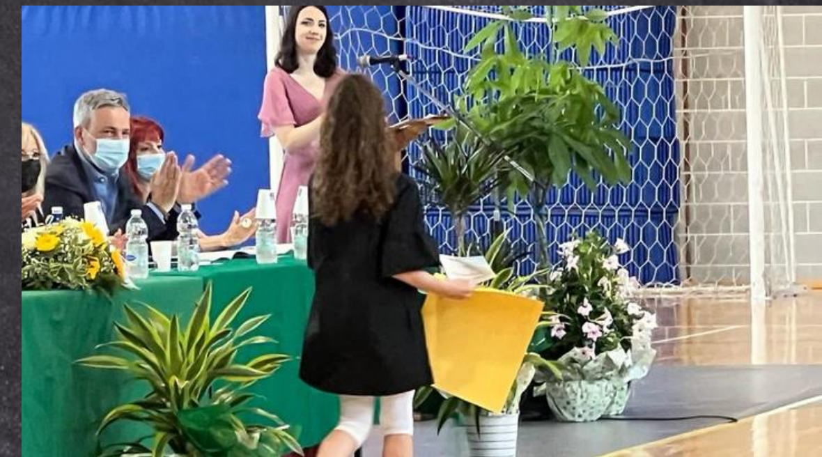
Concorso "Anch'io poeta"