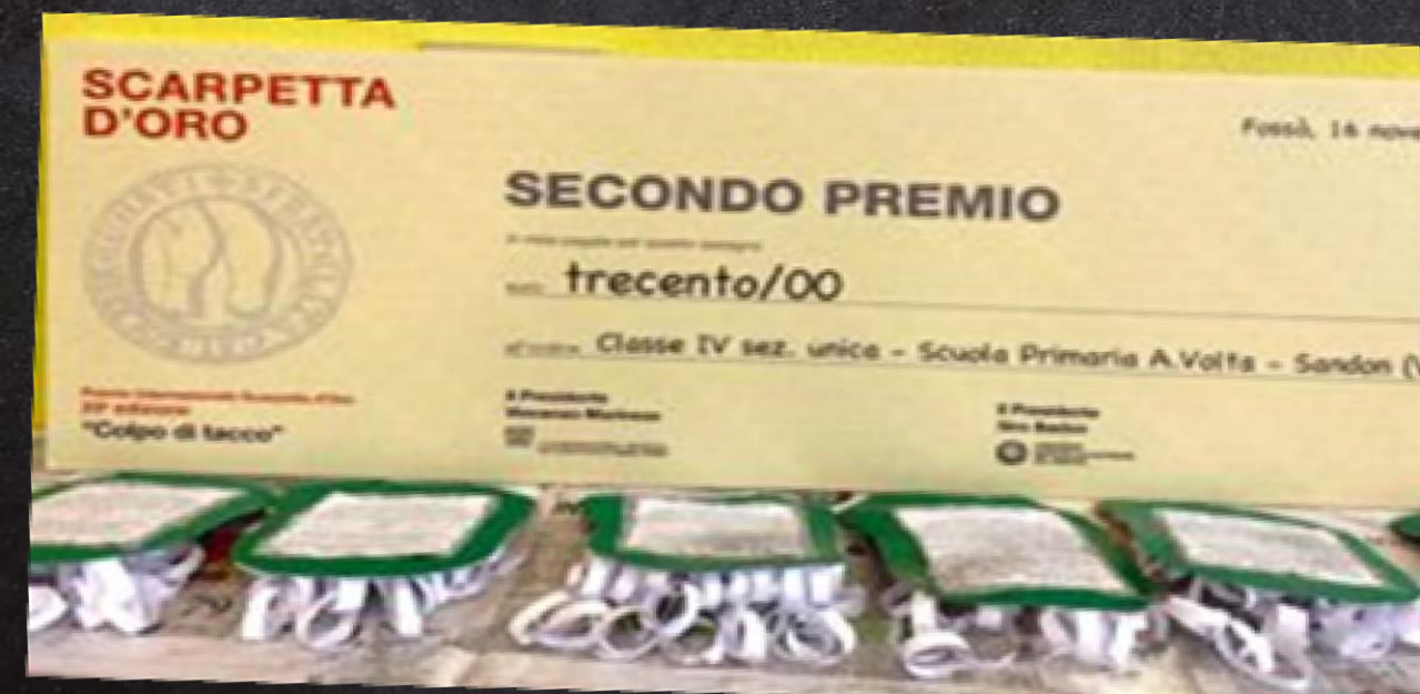
Concorso "Scarpetta d'oro"